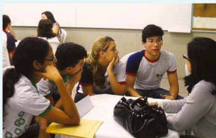
Profissional repassa para estudantes dicas valiosas sobre o futuro

O Ensino Médio é o momento decisivo para uma escolha que mudará toda uma vida futura: a carreira profissional. Como a cada ano os formandos saem da escola mais jovens (entre 16 e 17 anos), as dúvidas só aumentam. A responsabilidade dessa escolha deve ser dividida também entre os pais e a escola, no sentido de orientação. E essa orientação vocacional é o trabalho que vem sendo realizado pela escola há seis anos, a partir do projeto desenvolvido pelo Serviço de Psicologia e Psicopedagogia da instituição. Ajudar os jovens nessa importante decisão é o nosso grande objetivo. O programa se fundamenta na ideia de que é o próprio jovem que deve realizar o trabalho de busca e resolução do problema dessa escolha. Neste sentido colabora-se com informações sobre as profissões, promovendo-se atividades para o exercício do autoconhecimento, propicia-se o conhe-