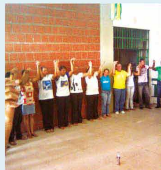
Escola investe em treinamentos junto aos profissionais da área administrativa e financeira