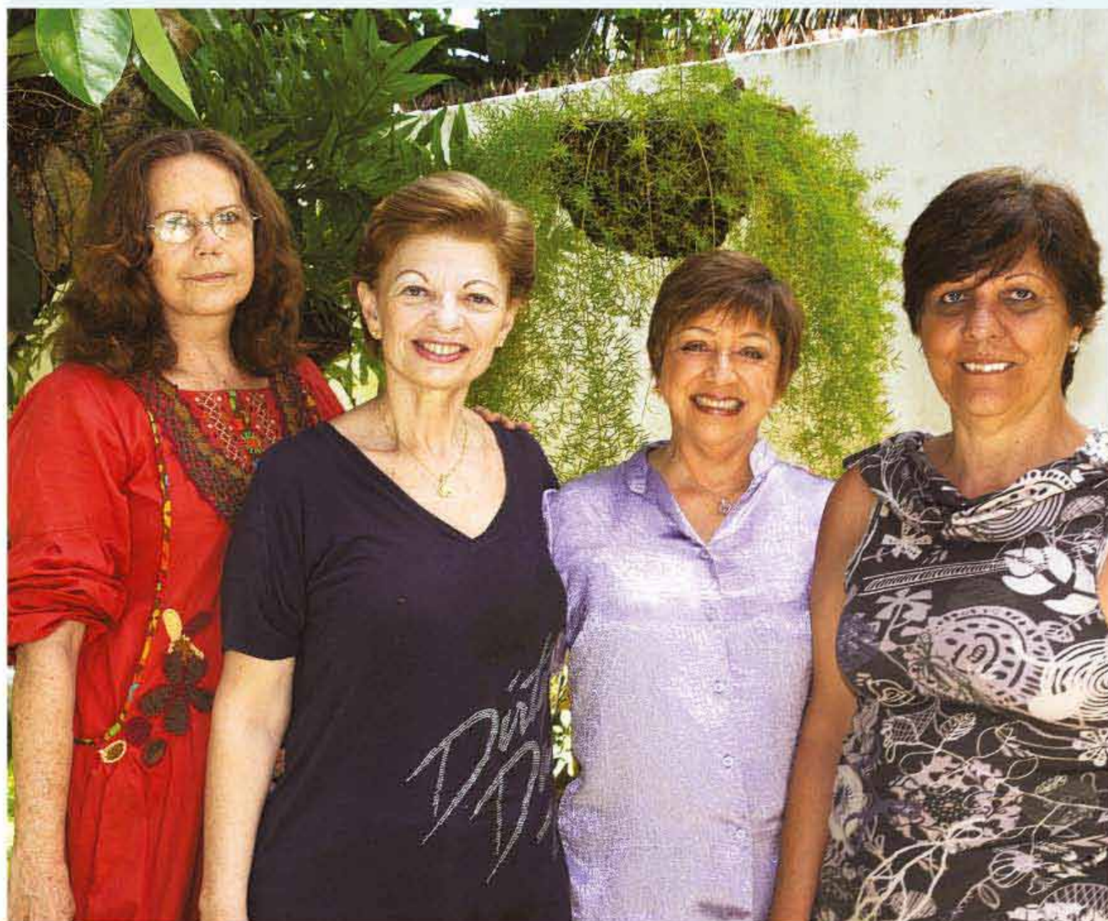
As diretoras da escola comemoram a nova etapa de consolidação de uma parceria vitoriosa