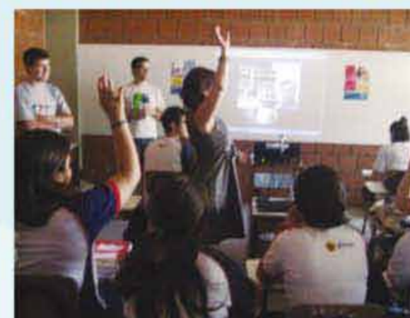
Alunos participaram ativamente do bate-papo e tiraram dúvidas com jovens da mesma idade